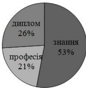
Рис. 3. Розподіл видів мотивації серед студентів 1 курсу медичного факультету.

взяли участь 91 студент 1 курсу (рис. 3). Мотивація на "придбання знань" склала 53% (48 опитаних студентів). Відповіді на запитання розділу свідчили, що студенти самостійно вивчають предмети, які, на їх думку, потрібні для оволодіння майбутньою професією, однаково глибоко вивчають всі навчальні дисципліни, ретельно готуються до іспитів, навчаються без періодичної стимуляції і нагадування адміністрації. При цьому 12 студентів, що склало 13% з усіх опитаних, показали "дуже високу" мотивацію на придбання знань.