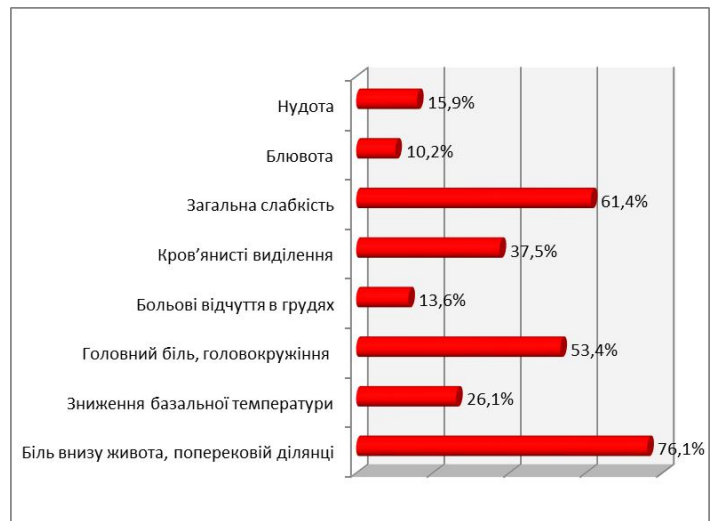
Рис. 1. Особливості перебігу вагітності у жінок із звичним невиношуванням в анамнезі.

При проведенні ретроспективного дослідження було отримано наступні дані: у 2009 році було на базі МКПБ №2 м. Вінниці було зареєстровано 66 випадків самовільного переривання вагітності, 114 випадків завмерлої вагітності; у 2010 році - 45 та 126; у 2011 році - 48 та